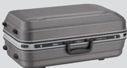
Θήκη φακού CT-608 (περιλαμβάνεται)