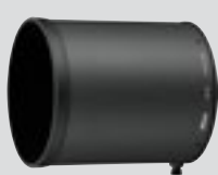
Σκίαστρο φακού HK-40 (περιλαμβάνεται)