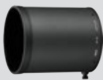
Σκίαστρο φακού HK-34 (περιλαμβάνεται)